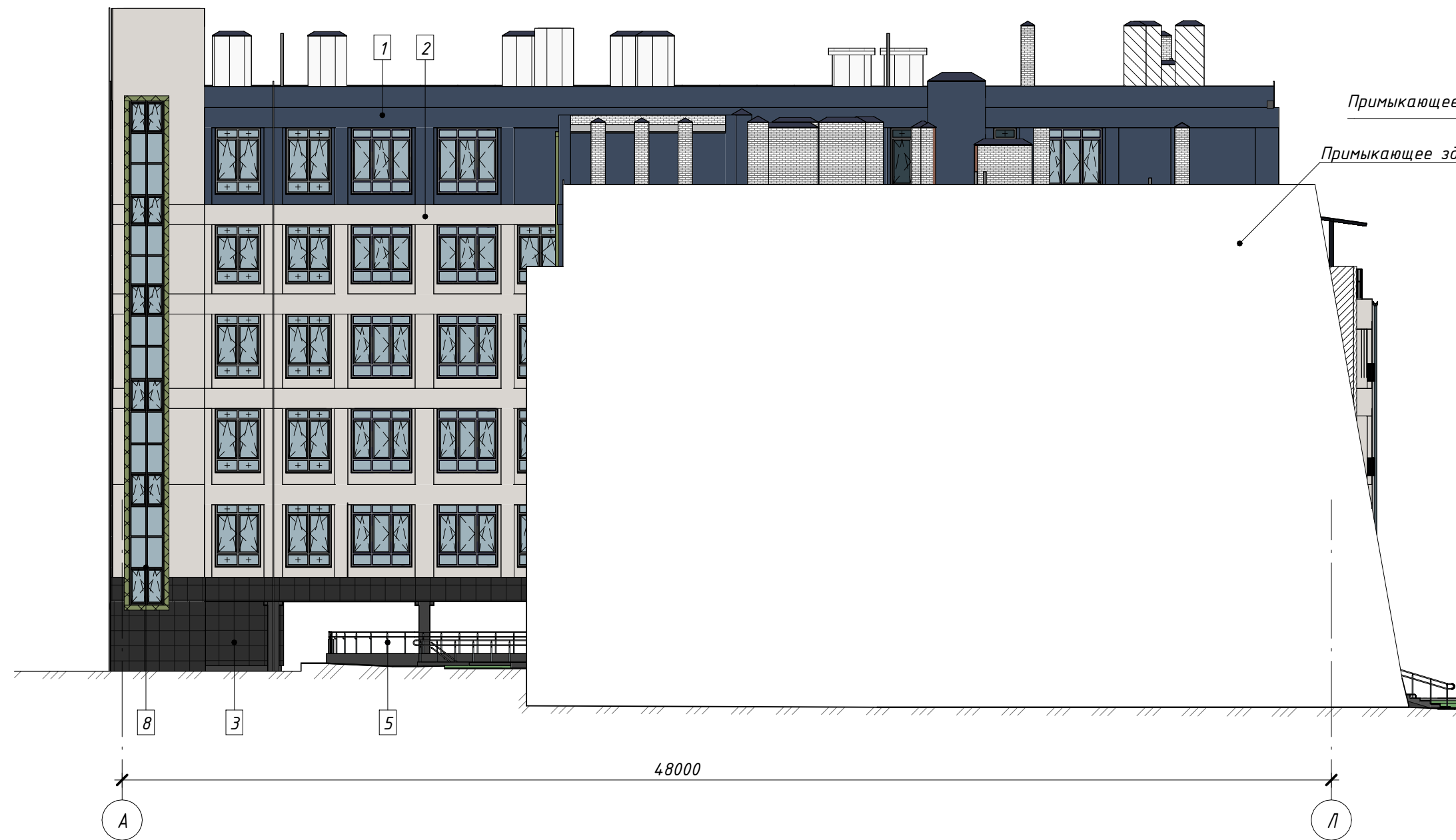
Фасад в осях А-Л